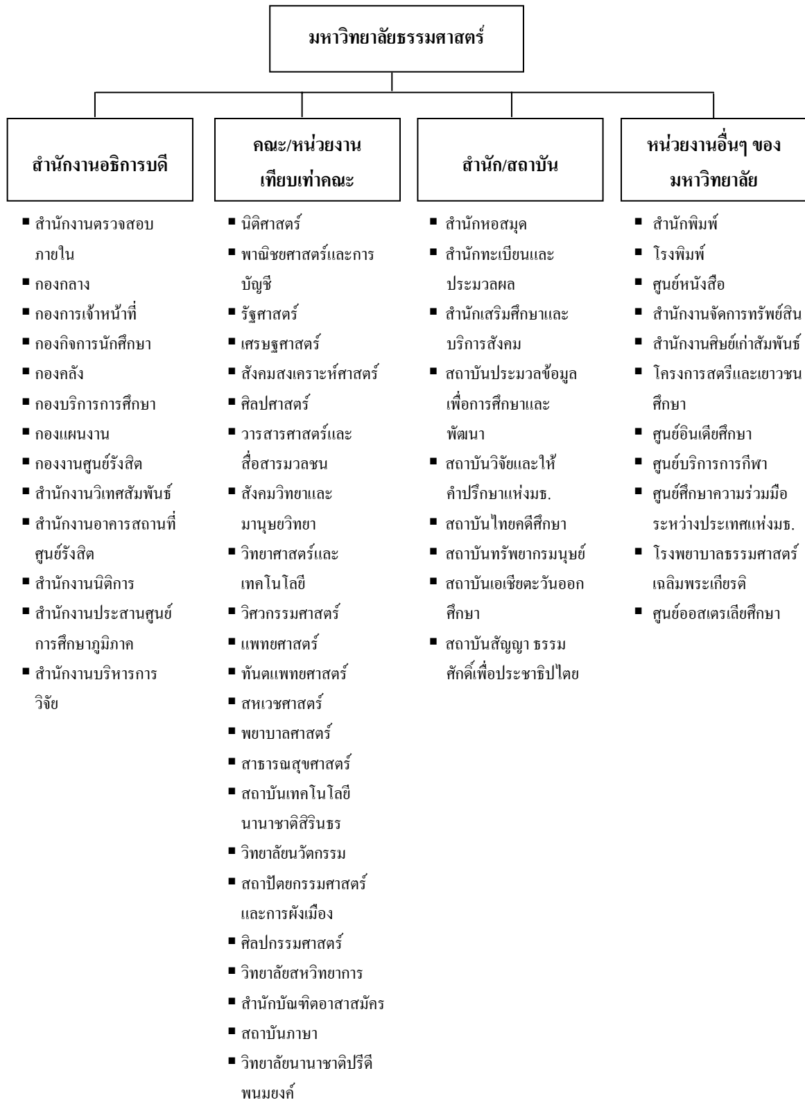
แผนภูมิที่ 1 การแบ่งส่วนราชการและหน่วยงาน ของมหาวิทยาลัยธรรมศาสตร์