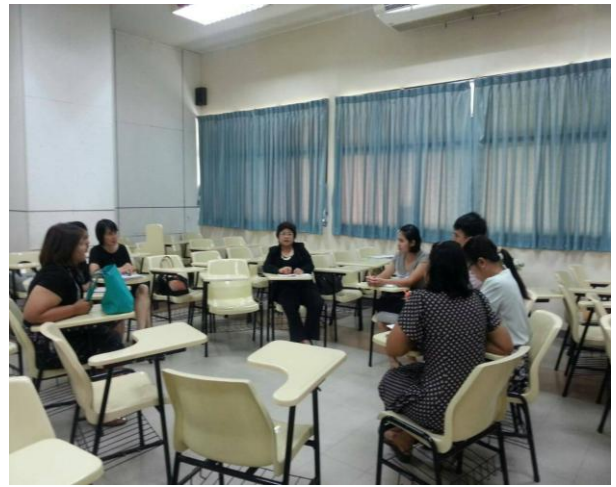
ภาพที่ 2 บรรยายภาศใน Journal Club

นอกจากนี้ด้านการส่งเสริมสนับสนุนให้นักศึกษามีความรู้ความสามารถในการทำวิจัย ที่ทำลักษณะเข้าค่ายดูแลเฉพาะเจาะจงจากทีมอาจารย์นั้น หลักสูตรได้ประยุกต์ให้เข้ากับบริบทของหลักสูตรที่เป็นหลักสูตรภาคปกติ จึงส่งเสริมสนับสนุนให้นักศึกษามีความรู้ความสามารถในการทำวิจัย ซึ่งเป็นเป้าประสงค์หลักอย่างหนึ่งของหลักสูตร โดยหลักสูตรฯมีกิจกรรม Journal Club ทุก 1-2 เดือน ซึ่งถือว่าเป็นนวัตกรรมของหลักสูตรเพื่อเพิ่มทักษะในการอ่าน การวิเคราะห์ และการนำประโยชน์ไปใช้ในการพัฒนาโครงร่างวิจัย อย่างน้อยภาคการศึกษาละ 2 ครั้งและการกำหนดให้มีระบบรายงานความก้าวหน้าของโครงร่างวิทยานิพนธ์ภาคการศึกษาละ 2 ครั้ง ซึ่งประยุกต์มาจากแนวคิดการนำนักศึกษาเข้าค่ายวิจัยของโรงเรียนพยาบาลรามาธิบดี และการนำเสนอ แต่ประยุกต์เป็นการพบปะกันแบบ Journal Club ในบรรยากาศของนักวิชาการและมีกัลยาณมิตร